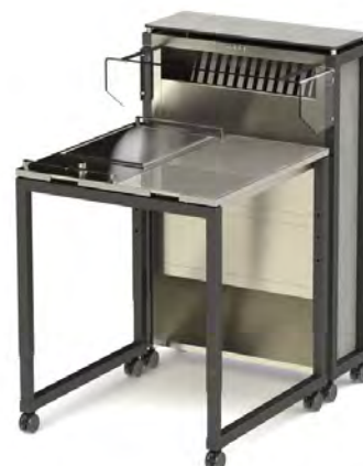
AIRMOBIL + STAGE_80_XS