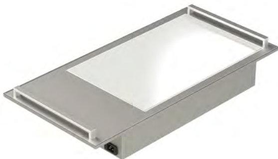
COOL + HOT